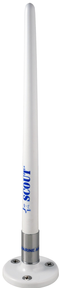
High flexibility and resistance

Die Antenne wird mit einem 4 m AM-FM Kabel und Schalter geliefert.