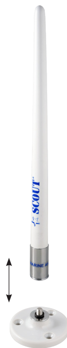
Fast whip removing